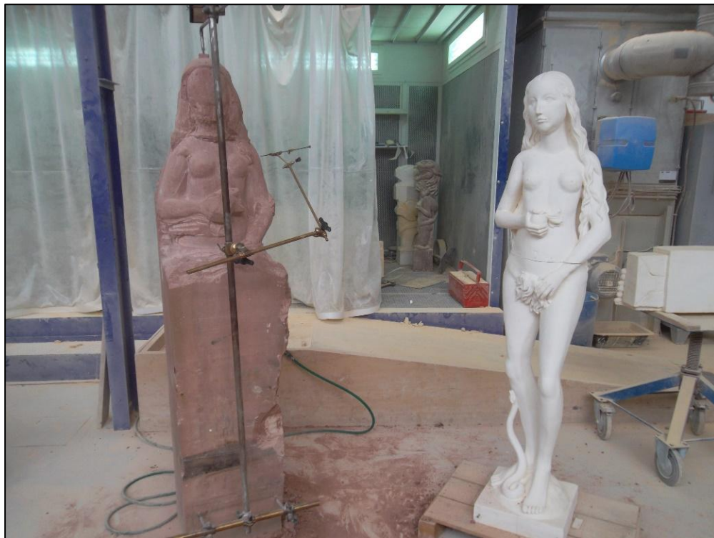
Croix de mise au point