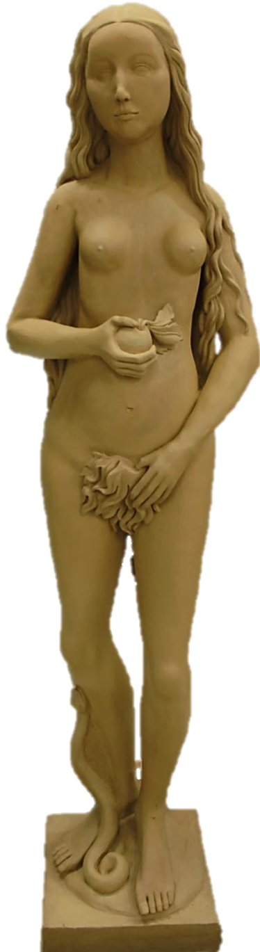
« Eve », Modelage argile