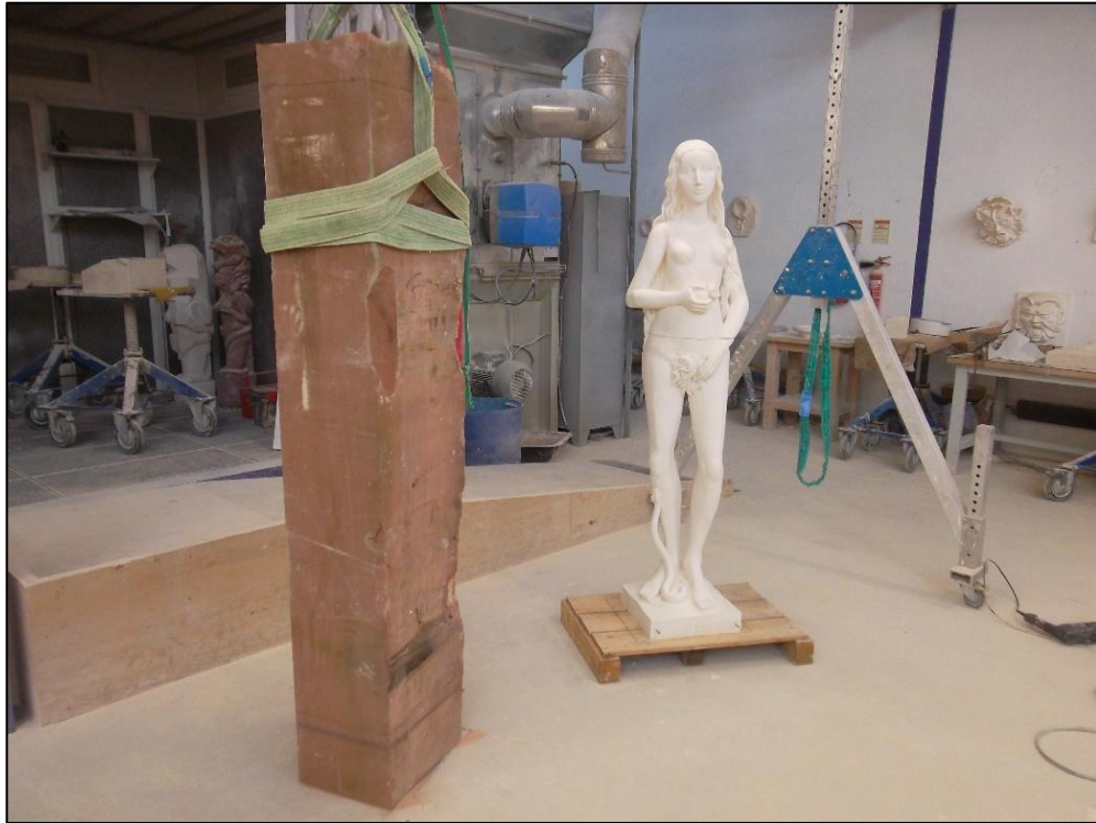
Bloc capable en grès