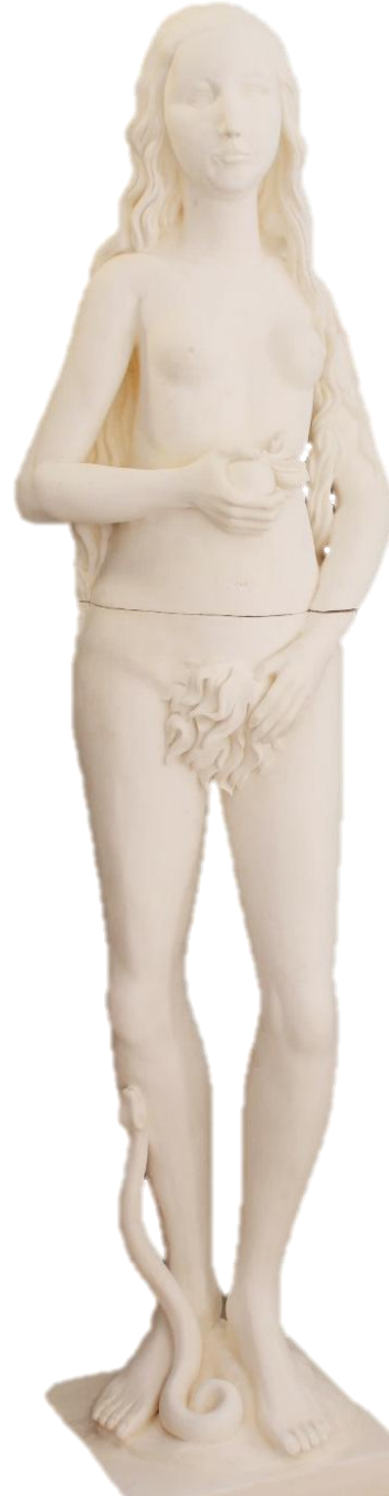
« Eve », Moulage plâtre